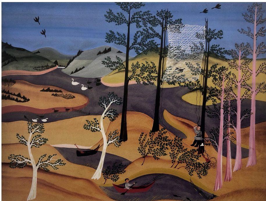
Рис. 1. Панков К. А. «Ловля птиц». 1936–1939. Бумага, гуашь. 67,8×86. Государственный Русский музей

Параллельно, в 1927 г., в Сибири разворачивались процессы институционализации регионального искусства. Известный советский художник, основатель Иркутского художественного училища И. Л. Копылов на первом съезде художников-сибиряков выступил с программной инициативой формирования особого — сибирского — изобразительного искусства. В своем выступлении он провел историко-культурные параллели, указав на универсальность обращения искусства к «корням народного творчества» как к источнику возрождения. Копылов констатировал, что если европейские мастера, подобно П. Гогену, были вынуждены искать «девственную почву, первобытную свежесть» в экзотических странах (Таити, Африка), то в Сибири «под руками» находится богатейший пласт «первобытного, азиатского». Согласно его прогнозу, Сибирь могла стать новым центром развития большого искусства, сопоставимым с европейскими художественными центрами [Первый сибирский съезд художников, 1927. С. 215].