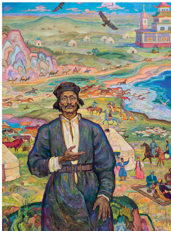
Джангарчи Ээлен Овла. 1969. Холст, масло. 180х130 см

прошлое», «Радость бытия», «Запах лотоса», «Противостояние» находит выражение обобщение размышлений художника о жизни и творчестве.