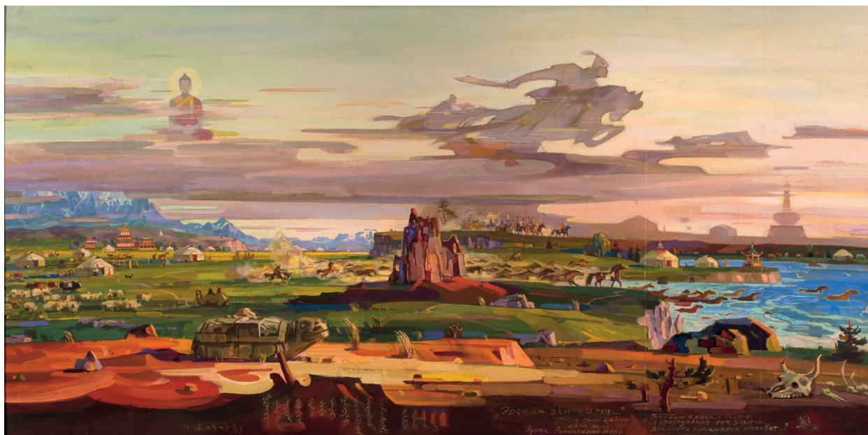
Эрдний экин цагт... Это было в начале времен... 1990. Оргалит, темпера. 95x180 см

Особо значимый раздел Альбома — «Буддизм как философия жизни». В нем исследуется работа художника над широко известным полотном «Ученый просветитель Зая-пандита — основатель старокалмыцкой письменности» (1979). С. Г. Батырева пишет: «Образ Зая-пандиты Г. О. Рокчинского хорошо известен в монгольском мире. В контурной прорисовке портрета воссоздан национальный идеал человека просветленного сознания и большой духовной культуры» [С. 174]. Ойрато-калмыцкий просветитель Зая-пандита Намкайджамцо (1599–1662) изображен в буддийском одеянии сидящим за чтением; на столе на развернутой ткани-баринтаг — рукописный том книги, один лист которой он держит в левой руке. В правой руке у него — кисть. Фоном служит условный степной пейзаж с невысокими холмами вдали, где шествуют в его красочном воображении верблюды и всадники Великого Шелкового Пути... Эстетика центральноазиатской живописи (строгая выверенная композиция, четкий рисунок, плоскостная трактовка пространства, внимание к деталям, условный фон) удивительным образом мягко сочетается с европейским перспективным сокращением в изображении книги, стола. В этот раздел автор включает «Буддийский натюрморт» (1990)