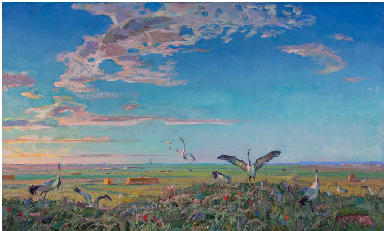
Журавлиная песня. 1972. ДВП, масло. 87х148 см

«Сайгаки» (1967). «Шавр цаца» (1987), на которой изображены мирно пасущиеся в степи лошади. Мифопоэтический образ природы — одухотворяющее начало его проникновенной живописи.