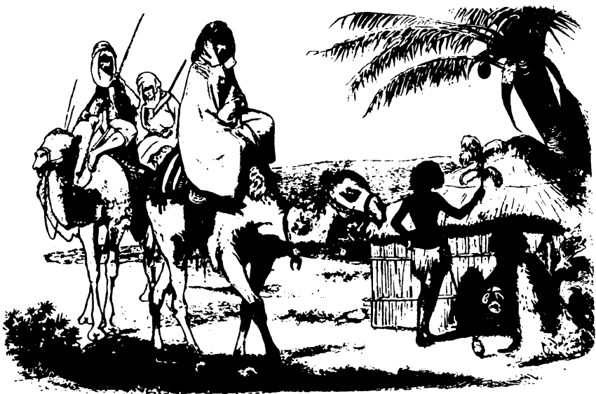
Е. П. Ковалевский во время путешествия по Африке в 1848 г.

за помощью. Многих из них он посетил на дому и видел "нужду потрясающую". "Еще долго, — писал он, — положение литераторов и их семейств не будет достаточно обеспечено; еще долго девизом их существования будут слова: работы и хлеба.