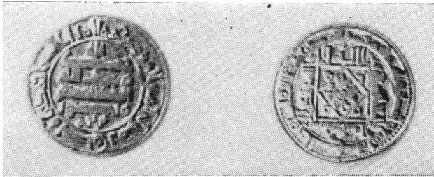
Рис. 1. К статье Е. А. Давидович. Саманидский фельс из крепости Махрам