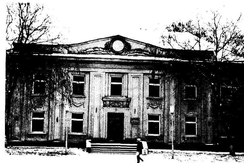
Берестовица. Здание Библиотеки им. О. Ковалевского. Современное фото