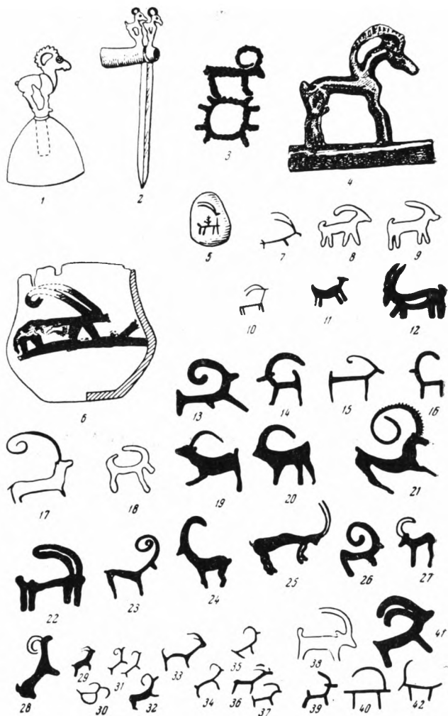
Рис. 2. Таблица М. Х. Маннай-оола (СА, 1967, № 1): 1, 2 — бронзовый боевой значок и ключец тагарской эпохи из Минусинской котловины (по С. В. Киселеву); 3 — изображения на угловом камне оградки раннетагарского кургана (по А. Н. Липскому); 4 — ручка бронзового тагарского котла из Минусинской котловины (по Э. Р. Рыгдылому и П. П. Хороших); 5 — каменная подвеска-печатка из погребения около рубежа нашей эры в Таджикистане (по Б. А. Литвинскому); 6 — сосуд с изображением козла из кургана, датированного второй половиной I тысячелетия до н. э., в Таджикистане (по А. Н. Зелинскому); 7—12 — изображения на шаманских бубнах и бытовых предметах тувинцев и алтайцев (по С. В. Иванову); 13—21 — наскальные рисунки Тувы (по А. Д. Грачу); 22—27 — наскальные рисунки Киргизии VII—I вв. до н. э. (по А. Н. Бернштаму); 28—37 — наскальные рисунки Казахстана VII—I вв. до н. э. (по Л. Р. Кызласову); 38—42 — наскальные рисунки Монголии (по Г. И. Боровке)