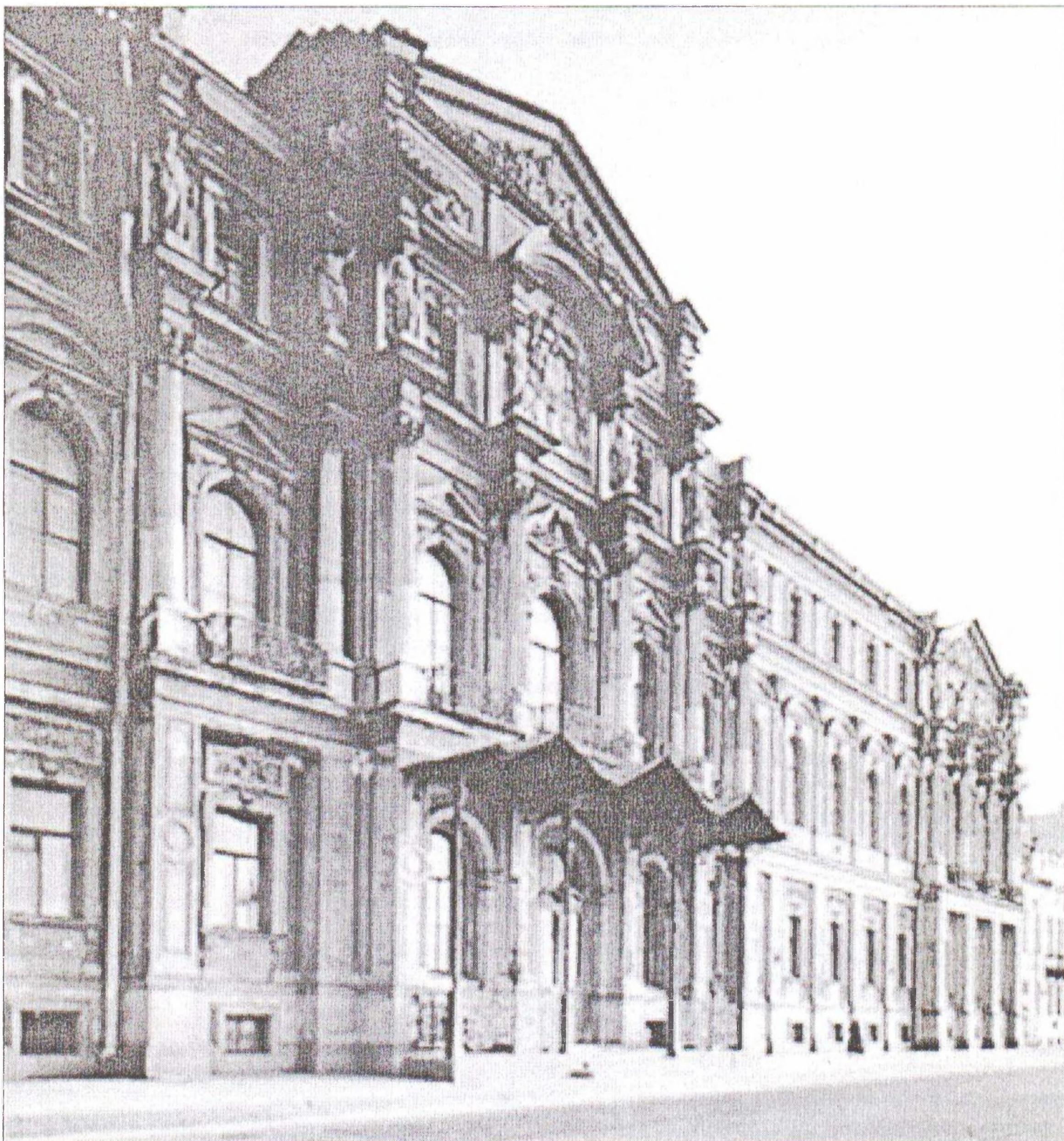
Азиатскому музею — Институту восточных рукописей РАН 190 лет. 1818—2008