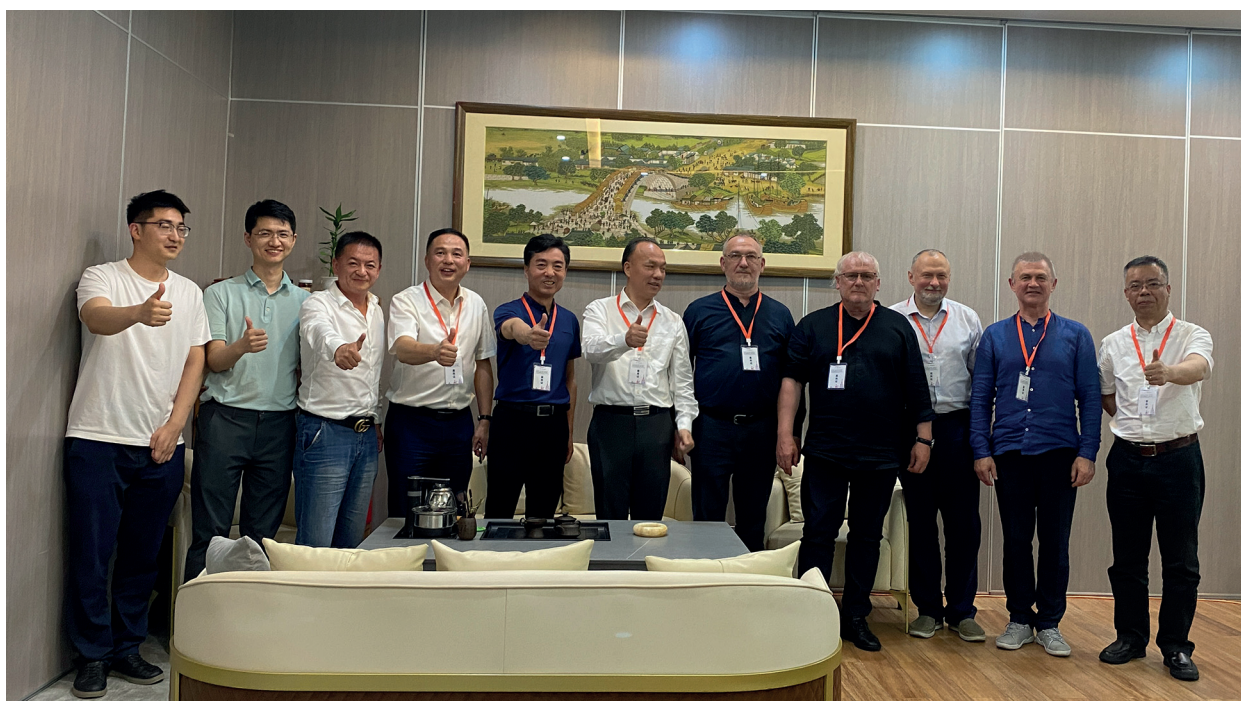
Встреча с профессорско-преподавательским составом Университета МГУ-ППИ

задач — представление современного русского классического искусства за рубежом, открыл новые перспективы сотрудничества с китайскими партнёрами. Принципиальным в данном случае, является понимание того, что наряду с возможностью коммуникации посредством