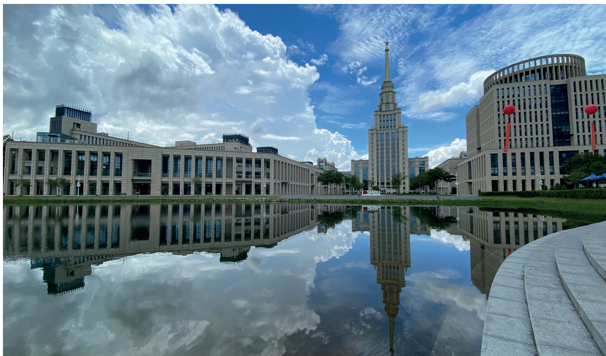
Кампус Университета МГУ-ППИ

В программе визита значился ряд традиционных художественно-образовательных мероприятий. Прежде всего, подготовка и