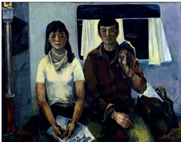
С. Элбэгдорж Шинэ хотын зүг

хөргүүд нь нь дүрийнхээ гадаад төрхийг төдийгүй, оюун санааны ертөнц, зан чанарыг нь илэрхийлж чадсан бөгөөд хоорондоо эрс ялгаатай, онцлог арга барил бүхий бүтээлүүд нь өдгөө ч судлаачдын анхаарлыг татсаар.