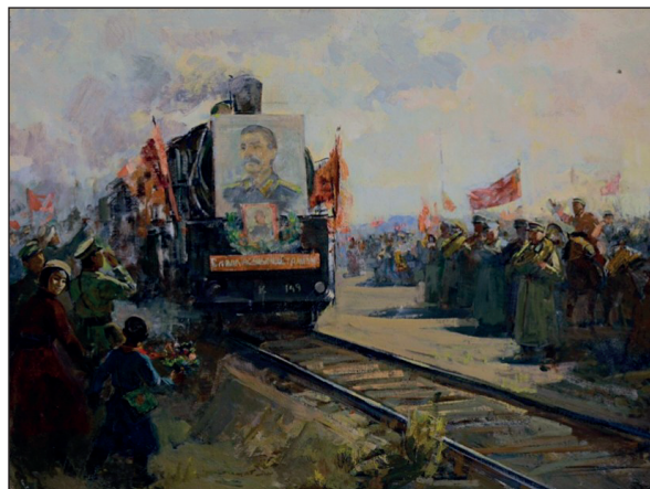
Пүрэвсүх Анхны галт тэрэг