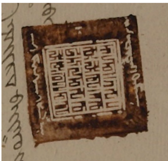
Рис. 1. Печать Есельбейн Сайн-Ка

Печать нанесена красными чернилами или тушью, потемневшей от времени. Печать имеет четырехугольную форму. Внутри кромки находится легенда на письме, которое в «Сказании о дербен ойратах» Батур Убаши Тюмень называет «индейским языком», на самом деле надпись сделана на ойратском и тибетском языках, причем, написана квадратным письмом Пагба-ламы. Текст надписи состоит из четырех колонок: yo kho ming ga ni A ha lag san no yo ni tham ga dgra shis .