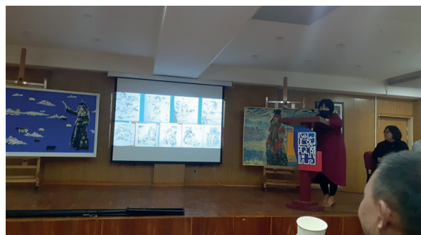
Олон сонирхолтой илтгэлүүдийг хэлэлцэв