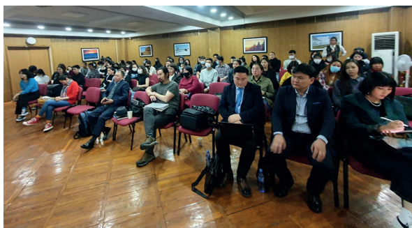
Хурал Уран зургийн галерейд болов