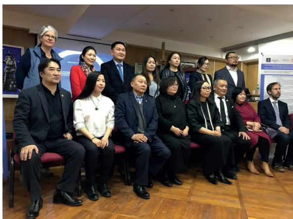
Эрдэмтэн судлаач илтгэгчид