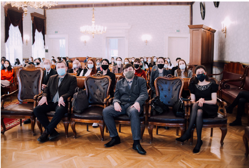
Участники конференции в Императорском зале КФУ

После награждения состоялось возложение цветов к памятнику Н. И. Лобачевского, российского математика, одного из создателей неевклидовой геометрии, деятеля университетского образования, который на протяжении 40 лет преподавал в Казанском университете и 19 лет руководил им в должности ректора.