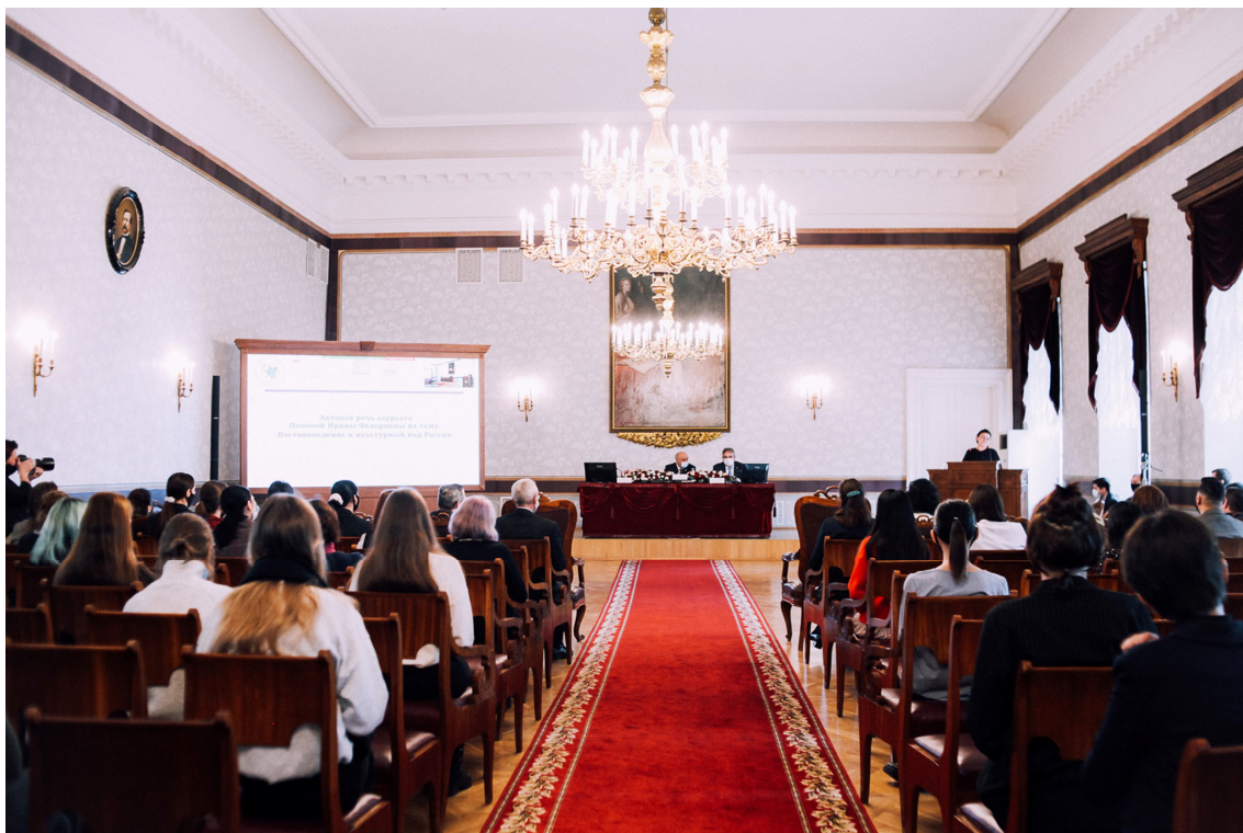
Открытие торжественного заседания Вторых Ковалевских чтений. Императорский зал Казанского федерального университета. 1 декабря 2020 г.

рятский государственный университет имени Доржи Банзарова, Институт буддологии, монголоведения и тибетологии СО РАН, Институт исследований Центральной Азии.