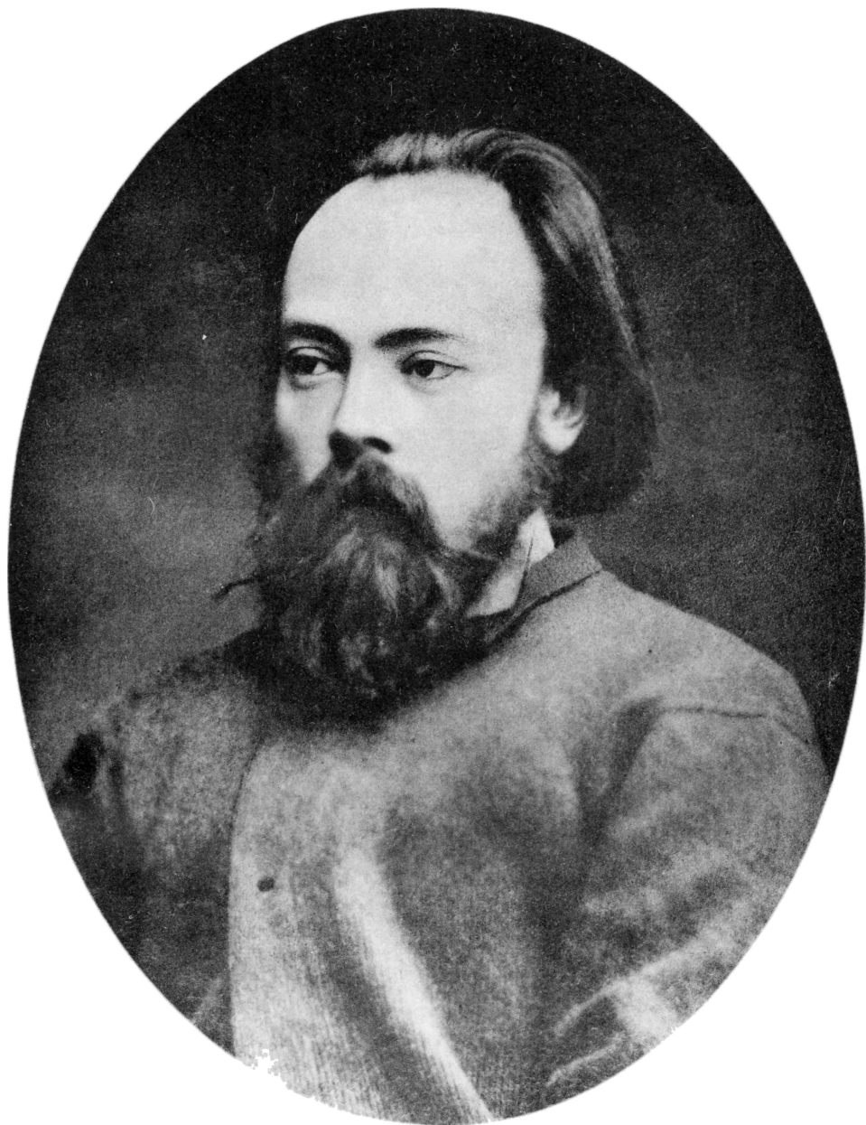
Дмитрій Александровичъ Клеменць въ 1875 \frac{1}{2} г.