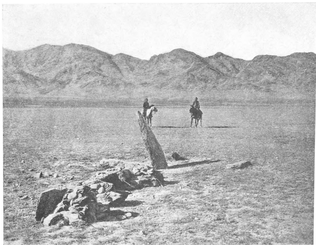
Рис. 1. Могила со стоякомъ.