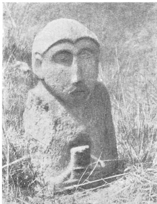
Рис. 4. Статуя у устья Джедана.