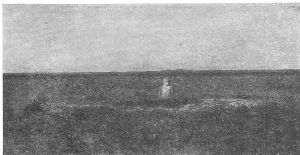
Рис. 1. Курганъ «Чингизъ-хана» въ Барлыцкой степи.