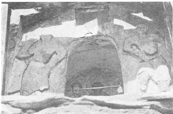
Рис. 2. Ниша Джурмалъ на р. Чакулъ (къ стр. 303).