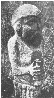
Рис. 3. Статуя на р. Джеданъ.