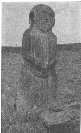
Рис. 2. Статуя въ долинь Кемчика.