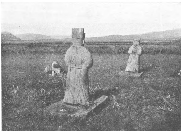
Рис. 2. Статуи въ Чакульской степи.