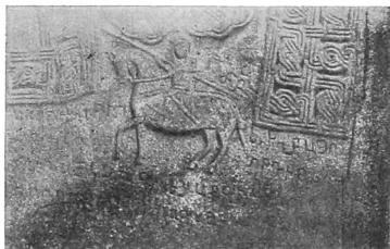
Рельефъ на I крестномъ камнѣ 1203 г. въ пустыни Кочинкъ.

Какъ видно на рисункѣ, голова лошади украшена особымъ значкомъ или неразвѣвающимся султаномъ съ рѣзко обозначенными контурами. Нѣкоторые кони осѣдланы; сѣдло хорошо видно, напр., на крестномъ камнѣ III. Въ другихъ случаяхъ, какъ на крестномъ камнѣ I, всадникъ видимо сидѣлъ либо на голой спинѣ лошади, либо на очень маленькомъ сѣдлѣ безъ лука, либо на чепракѣ, снабженномъ стременами; послѣднія два предположенія болѣе вѣроятны, такъ какъ безъ стремянъ ноги всадника не должны были бы принять то положеніе, какое онѣ имѣютъ; кромѣ того, съ сѣдломъ, или замѣняющимъ его чепракомъ, долженъ быть связанъ ремень, обхватывающій шею коня у груди и снабженный какимъ-то нагруднымъ украшеніемъ (см. рис.). На рисункѣ видна и уздечка съ широкимъ ремненнымъ кольцомъ, надѣтымъ на морду лошади. Рельефную шишечку, видную между мордой и шеей лошади едва-ли слѣдуетъ объяснять случайностью; скорѣе — это большая пышная кисть, связанная съ султаномъ или значкомъ, украшающимъ лобъ коня.