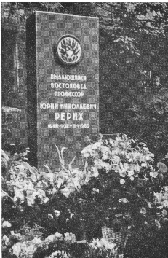
Памятник на могиле Ю. Н. Рериха

лал телеграмму советскому послу в Лондоне И. М. Майскому с просьбой зачислить его добровольцем в ряды Красной Армии.