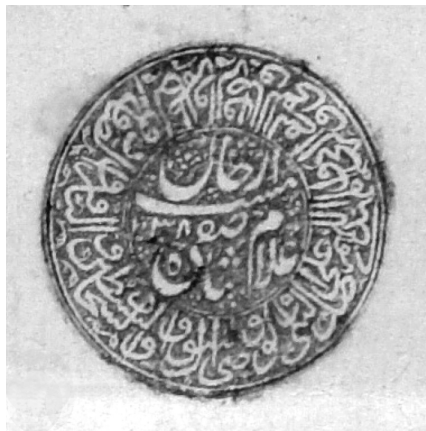
Ил. 1. Печать шаха Сафи I ( мухр-и хумайун ) Pl. 1. The Seal of Shah Safi I ( muhr-i humayun )