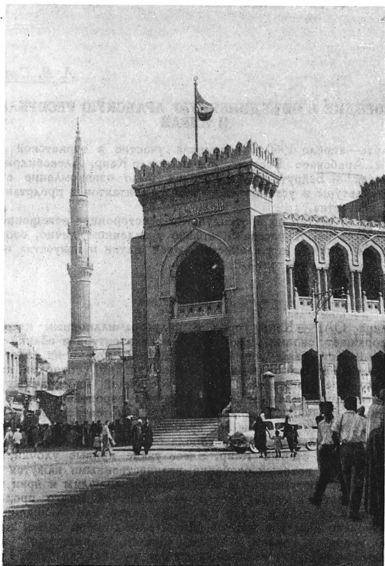
Рис. 1. Каир. Мусульманский университет Ал-Азхар.

ванная при династии Фатимидов в 970—972 гг. В одной из небольших пристроек находится могила полководца Джаухара ас-Сикилли (ум. в 992 г.), который в 969 г. основал г. Каир. В XII в., при Мам-