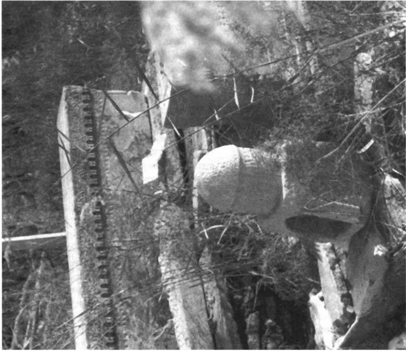
Чирэг-дан (Чхар Бакр, Бухара, середина XVIII в.).