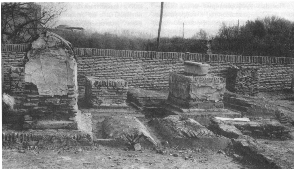
Сагана и дахмы начала XX в. Некрополь Чхар Бакр (Бухара).