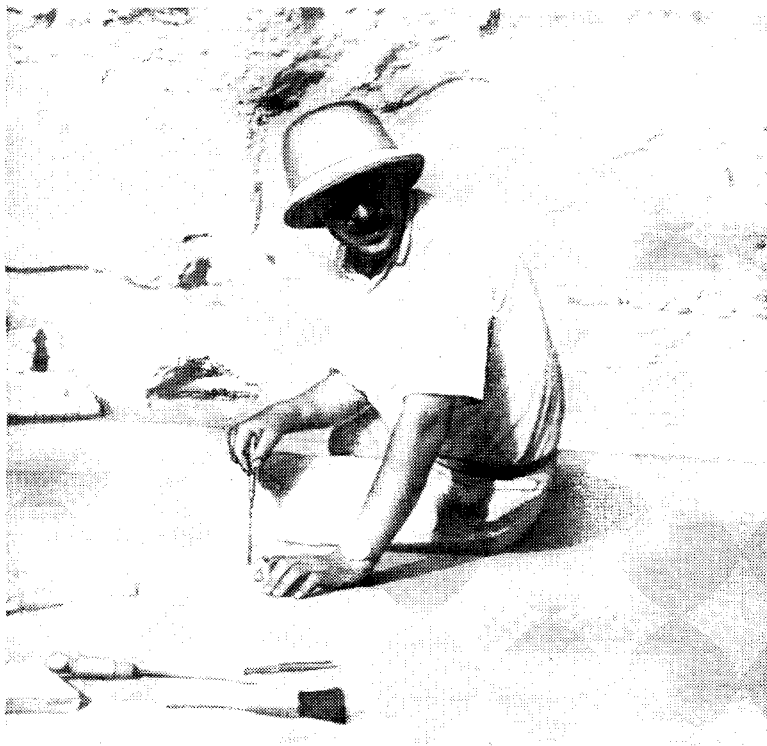
Рис. 1. С. П. Толстов на раскопках Топрак-калы. Зал воинов, 1949 г.

очертившие четким контуром дома-квартиры, распадающиеся на бесчисленные прямоугольники комнат. Перед нами в причудливой игре вечернего света предстал нарисованный на поверхности солончака план античного хорезмийского города» 8 .