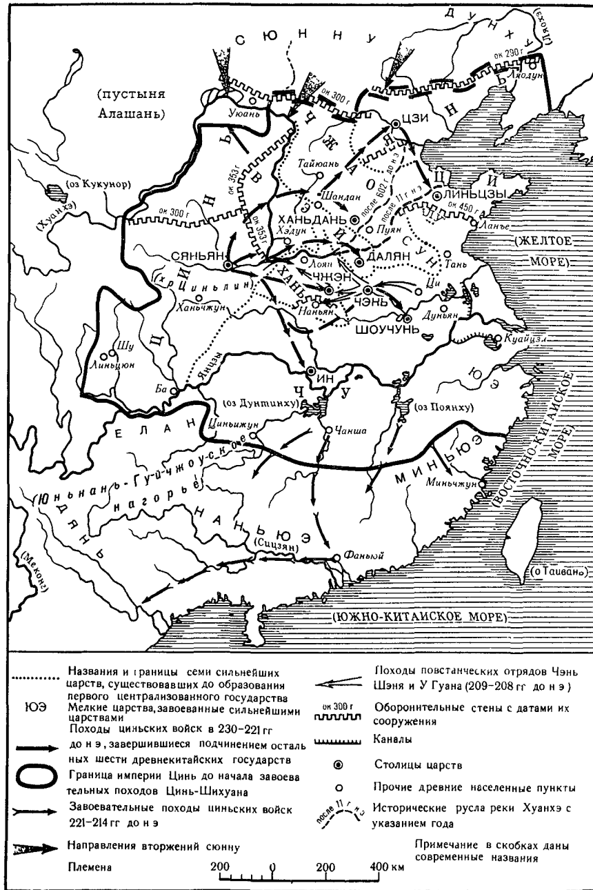
Китай в V–III вв. до н.э.