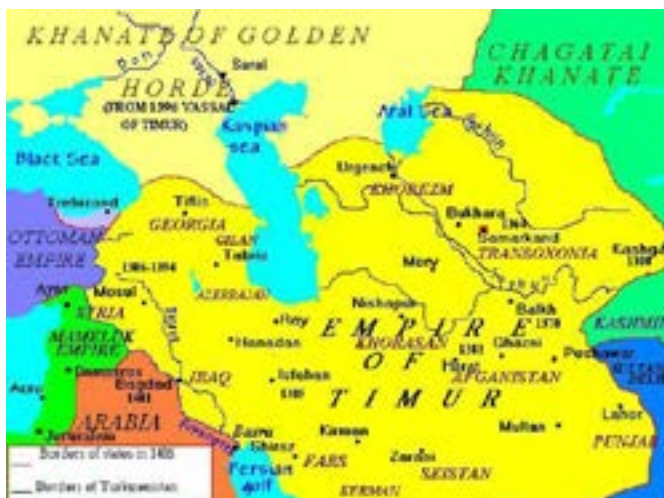
Эмир Төмөрийн улс /НТ. 1370-1405 он/

Хүн төрөлхтний түүхэнд монголчуудын оруулсан хувь нэмрийн талаар дурдахад Монголын эзэнт гүрний түүхийг эхлэн өгүүлдэгтэй адилаар Дундад Азийн ертөнцөд монголчуудын үлдээсэн ул мөрийг мөшгин үзэхэд эл зохиолын дотор буй баримтууд мөн чухал ач холбогдолтой. Уг зохиолыг сайтар задлан шинжилж үзвэл бүс нутгийн түүхэн дэх монгол гаралт нүүдэлчдийн түүхийг илүү тодорхой мэдэж болохоор байгаад зохиолын үнэ цэн оршино.