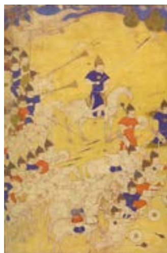
Эмир Төмөрийн цэрэг байлдаанд бэлтгэж байгаа нь.