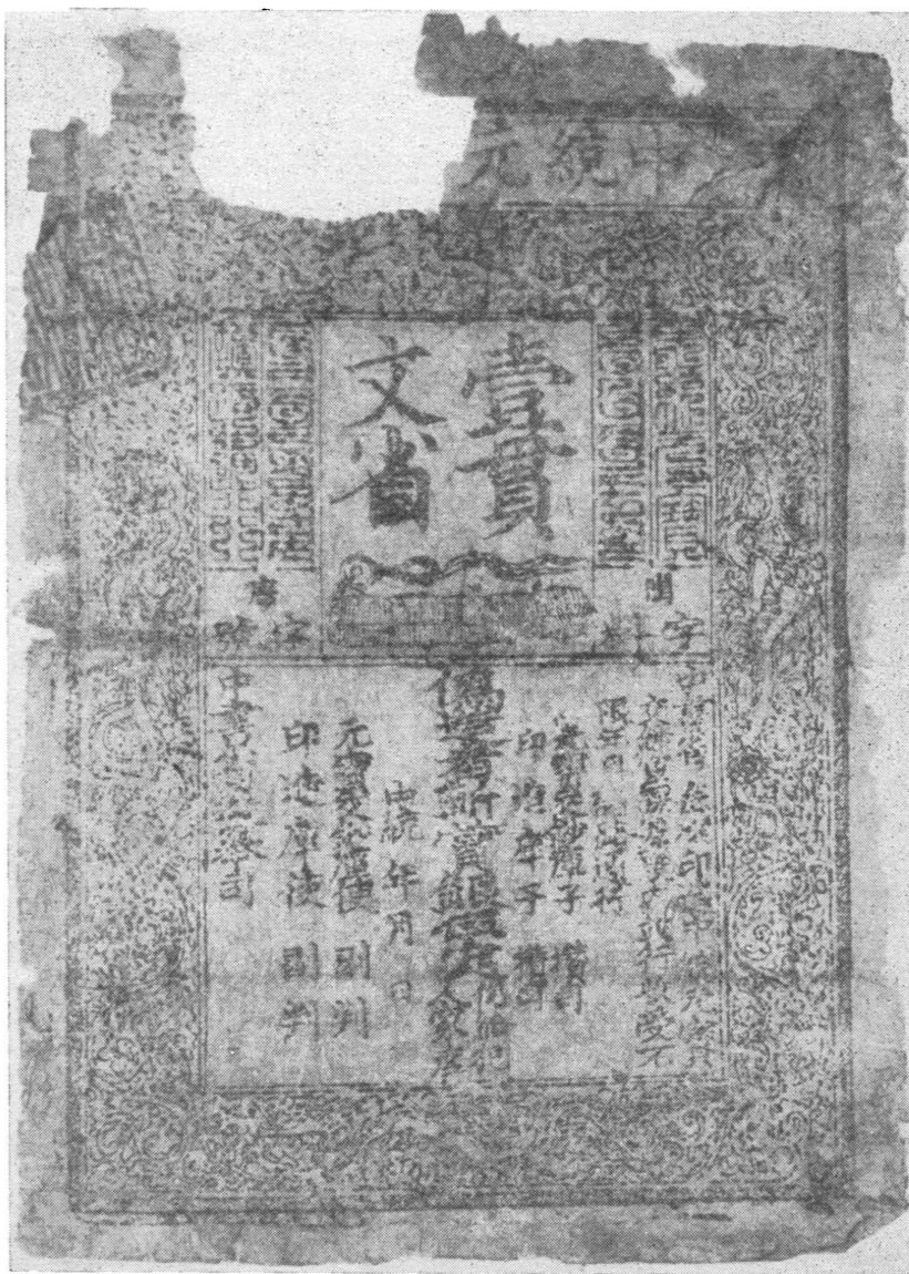
Рис. 3. Ассигнация периода «Чжун-тун» (1341—1368).

изготовить папку, словно как бумагу, только черную; и когда папка готова, приказывает нарезать из нее куски разной величины. Когда все приготовлено как следует, тогда главный чиновник, назначенный государем, окрашивает киноварью вверенную ему печать и прикладывает ее к бумажке, после этого монета считается подлинной... 1 Если бы кто подделал монету, он был бы подвергнут смертной казни... Приготовят бумажки... и распространяют их по всем областям, царствам, землям, всюду, где он властвует, и никто не смеет под страхом смерти их не принимать... Приходят купцы из Индии и из других стран с золотом, с се-