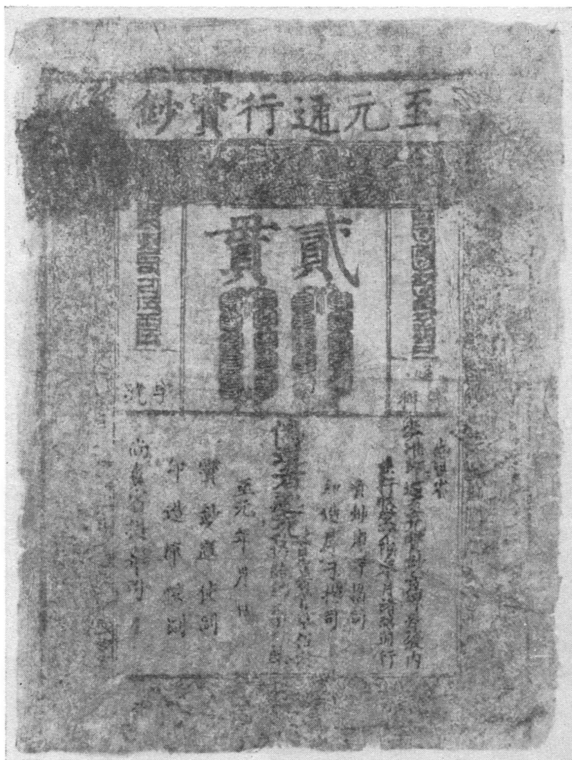
Рис. 2. Бумажные ассигнации. Ассигнация периода «Чжи-юань» (1287—1367) достоинством в 2 связки монет.

Надписи на цянях воспроизводят почерк императоров или знаменитых каллиграфов, почему эти монеты представляют известный интерес и как памятники искусства 1 . Изготавливались цяни путем отливки в формах без последующей чеканки.