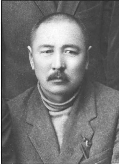
Б.Б. Барад'ян (оригинал хранится в Архиве востоковедов ИВР РАН, подготовлен к печати фотографом ИВР РАН С.Л. Шевельчинской)

ком отношении Дэргэское издание (в 101-м томе, то есть без нескольких дополнительных томов). Ганджур был передан в Азиатский музей будущим академиком О. фон Бётлингом (1815–1904) в 1842 г., то есть год спустя после приобретения второй коллекции Шиллинга 21 .