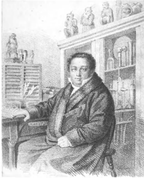
П.Л. Шиллинг фон Канштат

журами и утратили многие захваченные ими территории. В 1671 г. Аблай в ходе междоусобной борьбы потерпел поражение от знаменитого предводителя джунгар Галдан-Бошогту-хана (1645–1697) и бежал 3 . Монастырь и хранившаяся в нем библиотека остались без попечения.