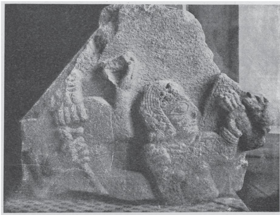
Рельеф, доставленный Я.Ф. Лундквистом в Кавказский музей в Тифлисе