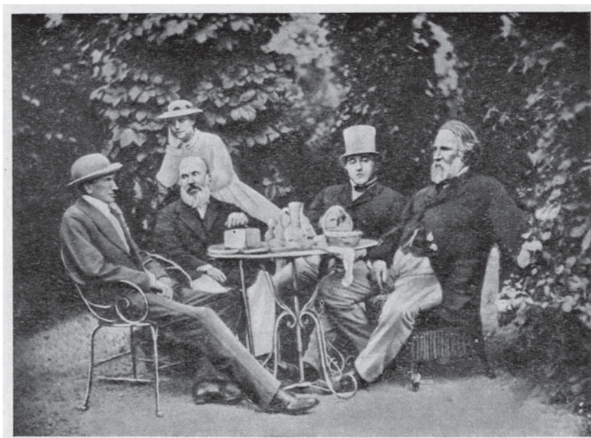
Н.В. Ханьков (рядом с И.С. Тургеневым) в Баден-Бадене, 1867 г.