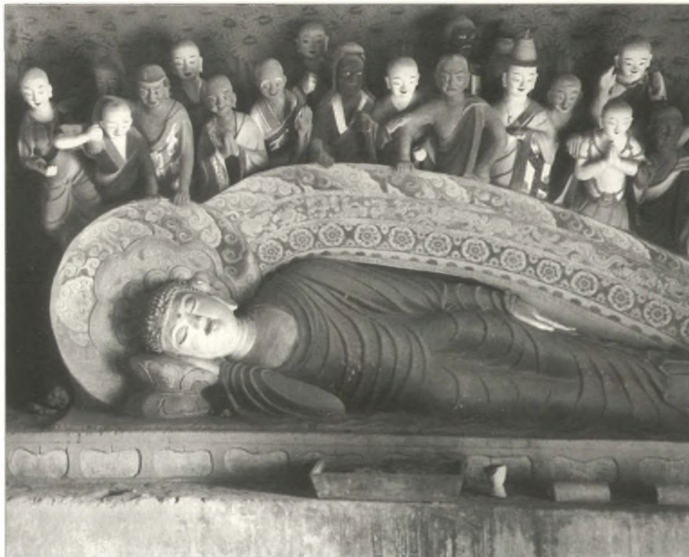
Дуньхуан. Пещера № 332 (146). 1914 Dunhuang. Cave No 332 (146). 1914