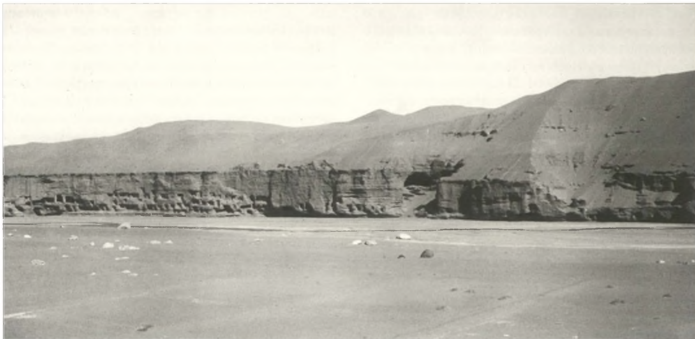
Дуньхуан. Общий вид пещерного монастырского комплекса Могаоку. 1914

In ancient and medieval times, the small town of Dunhuang was an outpost of the Chinese Empire on its far-away western borders, later on becoming an important transit point on the Silk Road, which passed through the frontier check-points in the Hexi Corridor and the Western Regions ( Xi yu ) of China further on to the West. The trade route was not only China's main artery for the exchange of merchandise with the Middle East, but it was also a way for China's cultural influence on the West — and, conversely, for the cultural influence of the West on China. From the 2nd to 3rd century on, Buddhism began to penetrate Northern China with tempestuous rapidity via Kashmir and Middle Asia and further through Khotan and Dunhuang. As time passed, the Western Regions came to pre-