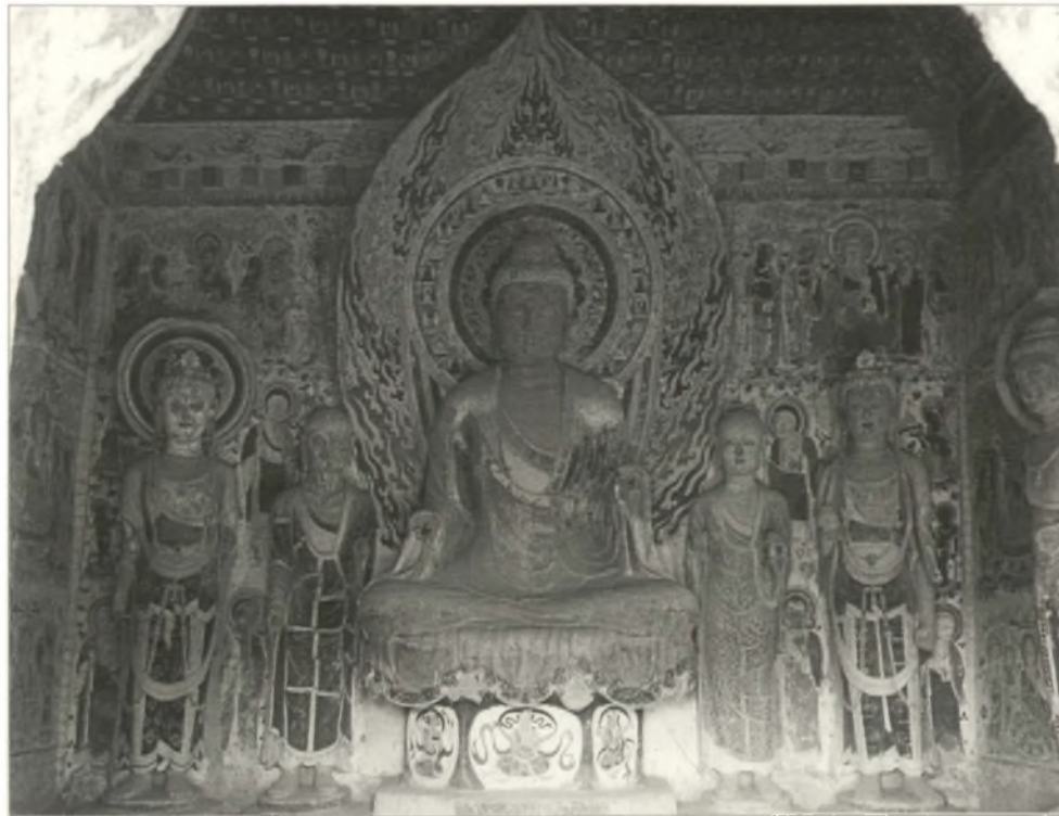
Дуньхуан. Пещера № 414 (136). 1914 Dunhuang. Cave No 414 (136). 1914